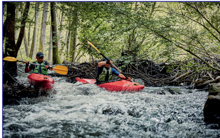
Przeprawa przez bystrza

Jest to także dobre miejsce na rozpoczęcie spływu, jeśli nie chcemy przenosić kajaki przez elektrownię. Tym bardziej, że stąd jest już niedaleko do starego jazu , przez który znów trzeba przenieść kajaki. Przenoska jest krótka, a za nią ciągnie się niewielki leśny odcinek.