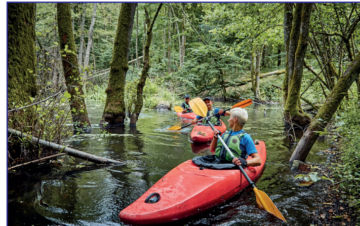
Spokojniejszy odcinek rzeki

Atrakcją wsi Oskowo jest nie tylko dwór z XIX wieku, ale przede wszystkim największa na świecie (fakt ten potwierdza wpis w księdze rekordów Guinnessa) replika „Konia Trojańskiego” o wysokości 15 metrów oraz rekonstrukcja obozu rzymskich legionistów otoczonego drewnianą palisadą. Inspirację dla obu przedsięwzięć zaczerpnięto z antycznego