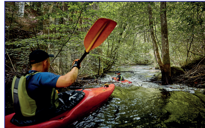
Nurt zaczyna się rozpędzać

Pierwsza wzmianka o wsi pochodzi z 1305 roku. Pod koniec XIX stulecia w Kozinie zwanym wówczas Koziańskim Młynem, osiedlili się katolicy Kaszubi. Z uwagi na nieprzychylną postawę zarządcy majątku, w którym pracowali Kaszubi, zbudowali kościół. Obiekt, który zachował się do naszych czasów, stanął na śródleśnym wzgórzu – ponad 3 km od wsi. W Kozinie funkcjonuje również elektrownia wodna oraz leśne arboretum przy leśniczówce. Miejscowość znana jest miłośnikom wspinaczki skałkowej ze względu na wykorzystywane przez nich pozostałości ceglanych mostów, będących pamiątką po przebiegającej dawniej przez wieś linii kolejowej.