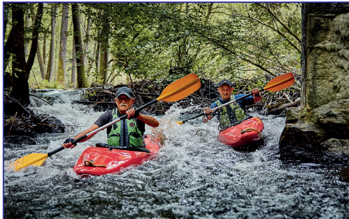
Bukowina to wymagająca rzeka

Rzeka jest spławna od mostu drogowego w Pałubicach (km 22,0). Najczęściej pływa się od Skrzyszewa (km 18,8), ponieważ odcinek górny prowadzi wśród podmokłych, porośniętych zaroślami łąk przez wymienione wcześniej jeziora, na których trzeba pokonać rozległe trzcinowiska.