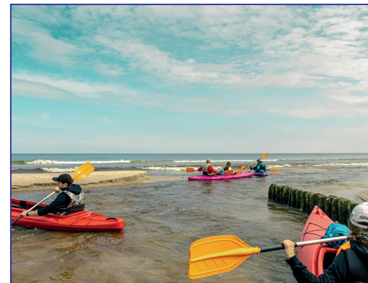
Zakończenie spływu w plażowej scenerii

a po prawej stronie wąska struga prowadzi wodę do Bałtyku. Rzeka przeciska się przez wał wydmowy i uchodzi do morza wprost przez plażę. W sezonie zabawne jest przepływanie kajakiem wśród tłumu plażowiczów i kąpiących się w strudze dzieci. Z pewnością widok uchodzącej rzeki do morza w plażowej scenerii jest nagrodą w spływie Czarną Wodą. Na plaży warto odpocząć, poopalać się i wykąpać. Przez rzekę bez problemu można przejść, gdyż jej głębokość przy ujściu to tylko kilkanaście centymetrów. Spływ najlepiej jest zakończyć na przystani w Ostrowie przy moście drogowym, do której trzeba wrócić pod prąd. Można też spróbować wypłynąć na morze, ale nie należy tego robić przy dużych falach i silnym wietrze. Fale przyboju mogą z łatwością wyrzucić kajak, a silne prądy wynieść go w głąb morza.