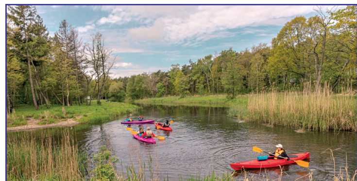
Rozlewisko Czarnej Wody w Ostrowie