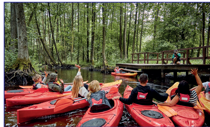
Czarne - przystań Sarniak

Spływ kajakowy najlepiej rozpocząć na przystani kajakowej w Sporyszu , obok mostu na drodze krajowej nr 25. Dojazd do przystani jest dość trudny, gdyż prowadzi do niego wyboista droga gruntowa, zaczynająca