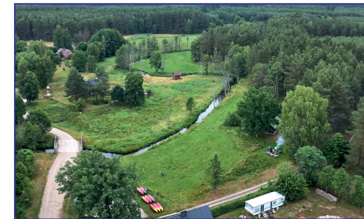
Przystań i pole biwakowe w Łuszczynie

Czernica uchodzi do Gwdy w Lubnicy . Spływ można zakończyć wiośnią około 700 metrów pod prąd do młyna w Lubnicy. Mija się wówczas po drodze duży most betonowy, zbudowany dla czołgów i prowadzący na poligon. Alternatywą jest mniej męczące spłynięcie Gwdą w dół rzeki do elektrowni wodnej Domyśl, położonej w pobliżu wsi Węgorzewo .