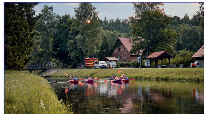
Nad nami woda pod nami woda

Po dalszych 3 kilometrach, od wsi Uboga okolica z wolną ponownie przybiera charakter typowy dla Borów Tucholskich. Kanał otaczają rozległe bory sosnowe, które towarzyszą kajakarzom do śródlądowej osady Fojutowo, w której kończy się spływ na terenie województwa pomorskiego . Dalej szlak płynie już w woj. kujawsko-pomorskim. Po drodze mijamy rozlewiska, a za mostem w Legbądzie Kanał przepływa pośród łąk. Dopływamy do jeziora Bartogi, z którego kanał wypływa pod zastawką zwany już Małym Kanałem Brdy, który jest przedłużeniem szlaku. Kanał płynie w nasypie, sprawia, że znajdujemy się powyżej otaczającego terenu. Po drodze mijamy kolejne, tym, razem mniejsze akwedukty i docieramy do jeziora Duk, gdzie przepływamy pod mostem drogowym koło wsi Biała. Kanał przebiega teraz przez tereny leśne aż docieramy do Zielonej Łąki. Tam przy