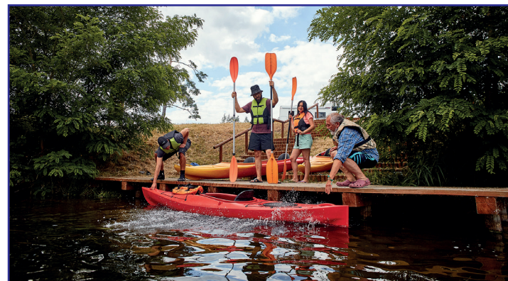
Przenoska w Rytlu

Wieża ucierpiała w 2017 roku w czasie katastrofalnej nawałnicy, gdy wieczorem 11 sierpnia przez zachodnią Polskę