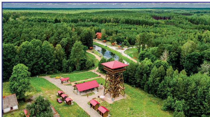
Wieża widokowa w Fojutowie

Wielki Kanał Brdy to wyjątkowa budowla hydrotechniczna, powstała w połowie XIX wieku jako dzieło niemieckiej myśli inżynierskiej. Wybudowano go w latach 1845–1949 w celu nawadniania łąk w suchej części Borów Tucholskich. Liczy blisko 30 kilometrów od Mylofa do Zielonki. Do jego powstania konieczne było spiętrzenie wód Brdy o 12 metrów. Tak powstała zaporą w Mylofie, będąca najstarszą taką konstrukcją na świecie. Dzięki wybudowaniu kanału nawodniono rozległy obszar Czerskich łąk, tworząc pastwiska, będące bazą pokarmową dla hodowli koni dla pruskiej kawalerii. Łącznie wykopano 21 kilometrów kanału, z czego 14 kilometrów biegnie w wykopie, a 7 kilometrów na nasypach. Szerokość kanału w koronie to 16 metrów, a w okresie szczytowym doprowadza średnio 9 m 3 wody na sekundę. Głębokość kanału wynosi zwykle około 1 metra, choć zdarzają się na nim wypłytenia.