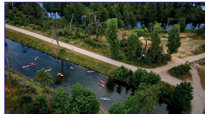
Początek spływu Kanałem Brdy w Konigorcie

W miejscowości Konigort oraz w Rytlu istnieje możliwość przeniesienia kajaka na Brdę (alternatywny sposób pokonania odcinka Brdy między Mylofem/Konigortem a Rytlem. Jest też możliwe wykonanie pętli na odcinku Rytel – Konigort (Wielkim Kanałem Brdy), a następnie Brdą do Rytla.